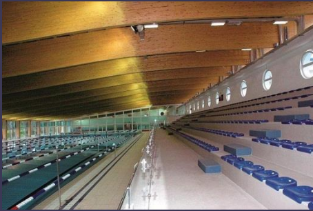
Inomhus 50 m