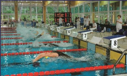
Ungdoms OL 2005!