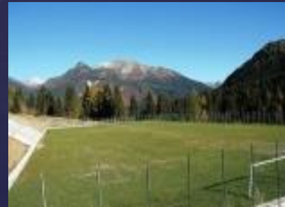
Fotboll på hög höjd!