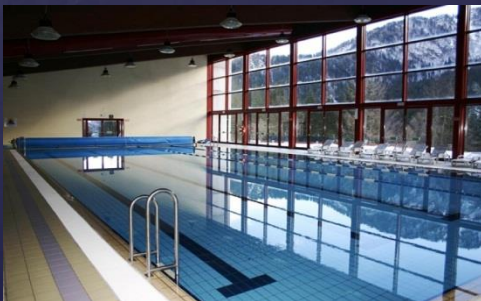
Inomhus i bergen!