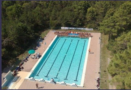
Utomhus 50 m