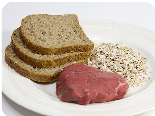
Fisk, kjøtt, fjærfe, grovt brød og korn er gode kilder til jern i kosten.

Behandlingen består av å øke inntak av jern i kosten hvis den er fattig på jernrike matvarer og eventuelt ta jerntilskudd i en periode. Hvorvidt utøveren skal ta jerntilskudd eller